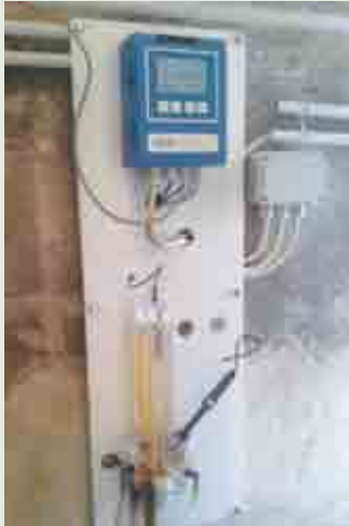
Figura 2 - Monitor AMI Trides installato a Grosseto