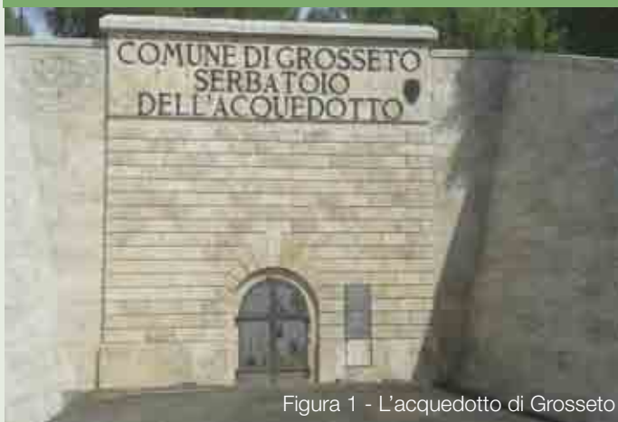
Figura 1 - L'acquedotto di Grosseto

Giorgio Capodanno - SWAN Analitica srl, Genova